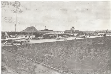
Na es momento cu e foto aki a wordo tuma tabata tin cuatro avion grandi ariba e pista di aterishe di nos aeropuerto Princesa Beatrix. Esaki ta demostra con e industria di turismo ta sigui floreciendo.

Gobierno Insular di Aruba mirando e necesidad di e centro aki ya for di varios añanan pasa, ta haci tur su posibel pa pronto e centro aki bin cla y cu nos patientnan no mester wordo trata otro caminda.